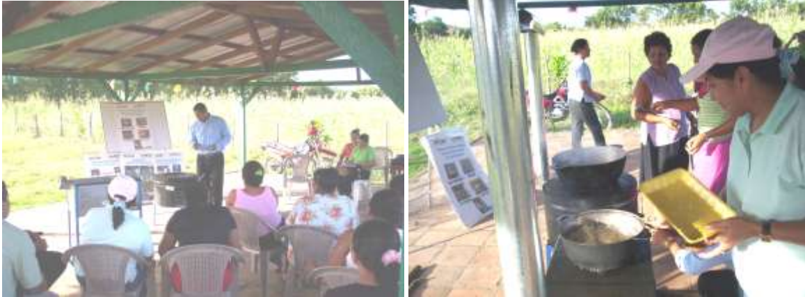
FOTO1: Capacitación en la comunidad Amatitán, León.