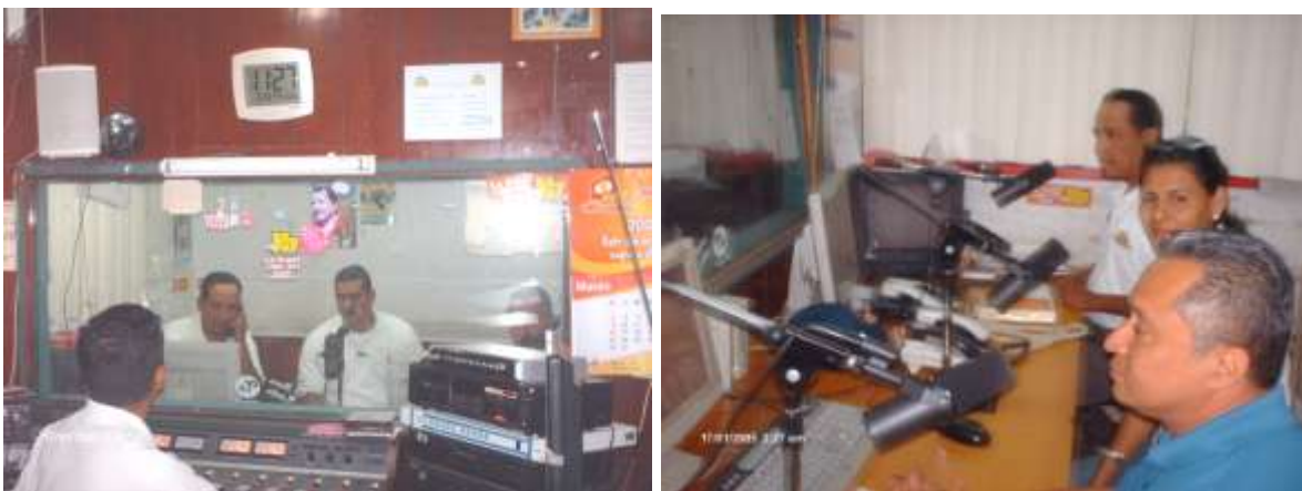
FOTO 11: Momentos en que se daba la entrevista al aire en la emisora Radio Ya.

Quedando pendiente para el mes de abril una segunda intervención, donde se llevara a una beneficiaria que tiene mas de cinco años de estar preparando diferentes alimentos en las cocinas Ecofogón.