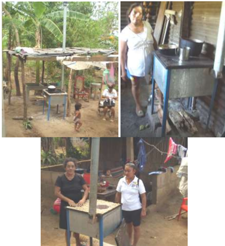
FOTO 6: cocinas instaladas a beneficiarias del organismo FUMUPROSOMUNIC

A partir de esta evaluación y de acuerdo a los beneficios que han logrado recibir las mujeres y la buena aceptación de las cocinas, la organización FUMUPROSOMUNIC, está contemplando continuar beneficiando a otras familias rurales que no estaban incluidas en la primera fase.