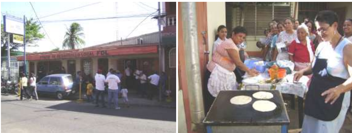
FOTO 5: Presentación en sucursal de la micro-financiera FDL, Managua.

Con respecto a las demás micro-financieras con las que tenemos convenio como son: Finca Nicaragua, FAMA y FODEN no se ha logrado avanzar por la falta de interés que han demostrado dichas financieras. La micro-financiera Finca de Nicaragua en este trimestre ha procedido a la devolución de cocinas que tenían bajo el concepto de consignación por falta de movimiento de las mismas.